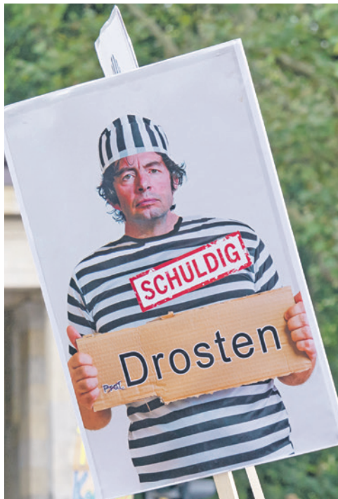
Christian Drosten hat diese These im März 2020 publiziert. Obwohl längst widerlegt, werden alle darauf beruhenden Massnahmen unbeirrt fortgesetzt!

Am 20. November 2020 hat eine breitangelegte Studie aus China für Aufsehen gesorgt, an welcher 9.899.828 Mio. Einwohner der Stadt Wuhan (rund 92,9% der Stadtbevölkerung) teilgenommen haben. Zusammenfassend kommen die Forscher aus Wuhan zu dem Ergebnis,