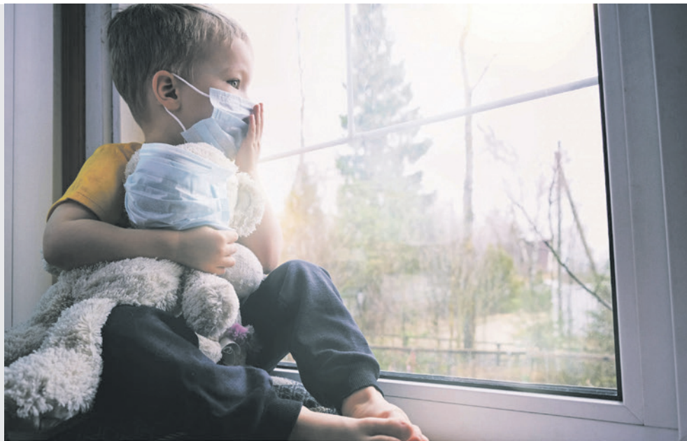
Kinder sind die Leidtragenden des politischen Irrsinns. Gesundheitsämter haben wiederholt Eltern dazu aufgefordert, ihre Kinder in häuslicher Quarantäne von der Familie zu isolieren.

te, erteilt wurden. Und zwar auf einer Datenbasis, die uns vor März 2020 eher ins Gefängnis gebracht hätte als die Möglichkeit zu eröffnen, diesen Impfstoff vermarkten zu dürfen. Diese befristeten Zulassungen sind übrigens mit einer Unzahl von Auflagen verbunden, die, wie wir heute schon wissen und einige Hersteller sogar selber zugeben, innert dieser Frist nicht erfüllbar sind. Und das ist auch nachvollziehbar denn im Normalfall dauert die Entwicklung rund 8 bis 12 Jahre, nun soll es plötzlich in 7 bis 11 Monate möglich sein, da kann man nicht seriös und gründlich arbeiten. Und die ersten Folgen davon sehen wir ja jetzt schon.