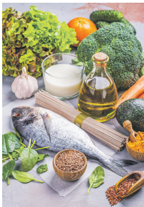
Gesunde Ernährung, viel Bewegung und frische Luft stärken das Immunsystem und schützen vor viralen Erkrankungen.

Weitere Infos: www.schuetzt-die-kinder.ch