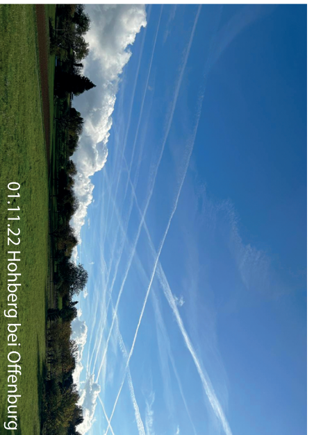
01.11.22 Hohberg bei Offenburg

Wenn Du heute an sonnigen Tagen in den Himmel schaut, findest Du sehr oft Schachbrettmuster von sogenannten „Kondensstreifen“.