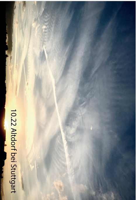
10.22 Altdorf bei Stuttgart

Weltweit erzählen uns Medien und Politiker, es gäbe einen menschengemachten Klimawandel. Kritische Berichte von Wissenschaftlern weltweit, die diese Behauptungen widerlegen, gibt es zuhauf, finden aber keinen Platz in den leider oft ideologisch geprägten Massen-Medien. Dabei ist eines klar: Mit dem Narrativ „menschengemachter Klimawandel“ wird sehr viel Geld verdient und stark Einfluss auf das Verhalten der Menschen genommen.